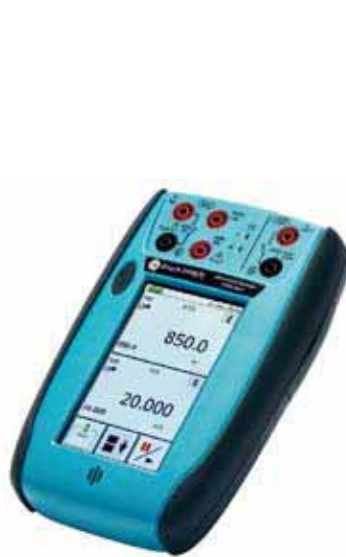
Messen und Geben von mA, mV, V, Ohm, Frequenz, Widerstandsthermometern und Thermoelementen

Das robuste, ausgeklügelte Design kombiniert erstmals einen modernen elektrischen Multifunktionskalibrator mit einer integrierten Druckmessung und -erzeugung, so dass ein universeller Einsatz möglich ist und keine Wünsche offen bleiben.