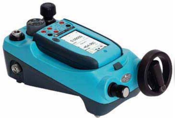
Druckmessung und -erzeugung von 25 mbar (10 inH 2 O) bis 1000 bar (15000 psi) mit austauschbaren Drucksensor-Modulen