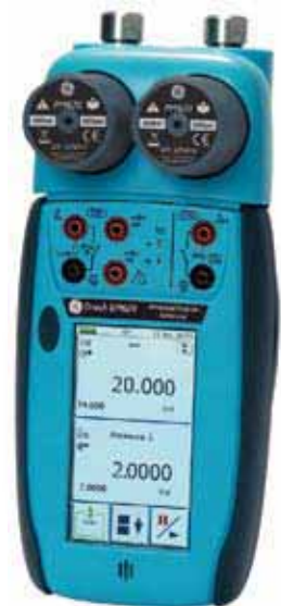
Zweikanal-Druckmessung von 25 mbar (10 inH 2 O) bis 1000 bar (15000 psi) mit austauschbaren Drucksensor-Modulen