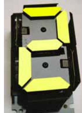
Bistabile Anzeige- technik