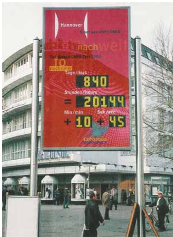
LCD-Countdownuhr doppelseitig, für EXPO 2000 in Hannover, Zifferhöhe 220 mm. Seit der EXPO zählt die Anzeige vorwärts.

Rückwärtszählenden Olympiuhr für Leipzig 2012