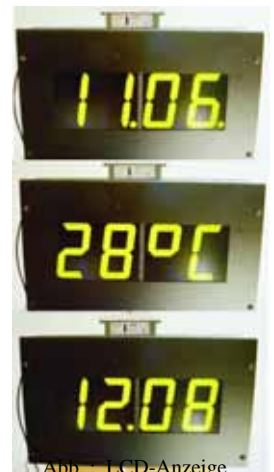
Abb. ... LCD-Anzeige